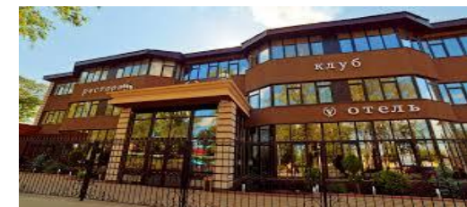
гостиницы, кафе и рестораны