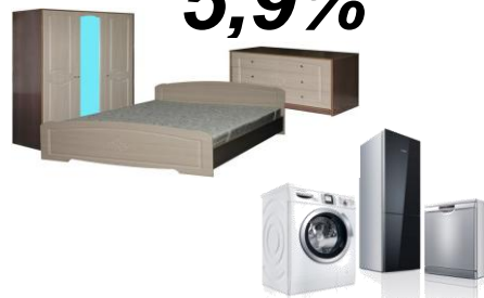
предметы домашнего обихода, бытовая техника и уход за домом