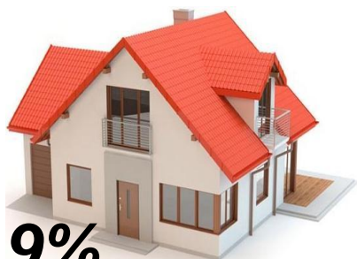
ЖКУ и другие расходы на жилье