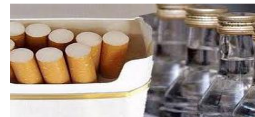
алкогольные напитки, табачные изделия