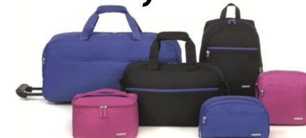
прочие товары и услуги